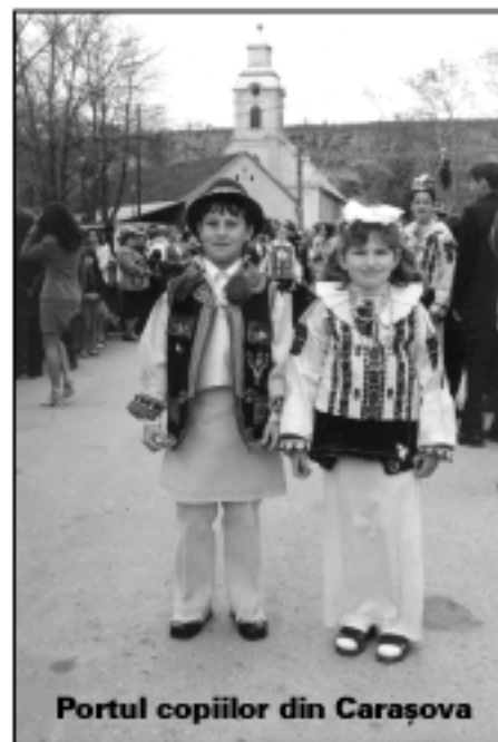
Portul copiilor din Carașova

Croații din România vorbesc trei tipuri de graiuri. Cei din grupul croaților carașoveni păstrează cele mai arhaice forme ale limbii croate vorbite, fapt care a atras atât cercetătorii