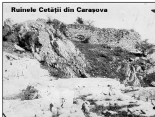
Ruinele Cetății din Carașova

Învățământul public a luat ființă încă din a doua jumătate a secolului al XVIII-lea prin grija călugărilor iezuiți, care au pus bazele școlilor confesionale în limba maternă. Cu mici excepții, învățământul în limba maternă a funcționat până în anul 1960, urmând o perioadă de întrerupere totală a acestuia. După 1990 în Carașova se reînființează secții în limba croată, iar la ora actuală funcționează Liceul bilingv româno-croat, de pe băncile căruia a ieșit în anul 2000 prima promoție de absolvenți. Limba maternă, ca obiect de studiu, se învață în toate unitățile școlare. Din rândul comunității croate au activat și activează profesori universitari, avocați, mai mulți preoți, profesori cu studii superioare, absolvenți ai institutelor de diferite specialități. Până la ora actuală peste treizeci de tineri au urmat cursuri ale învățământului superior la Zagreb, în Croația. Mulți dintre absolvenți își valorifică cunoștințele la catedrele de limba croată în cadrul comunității.