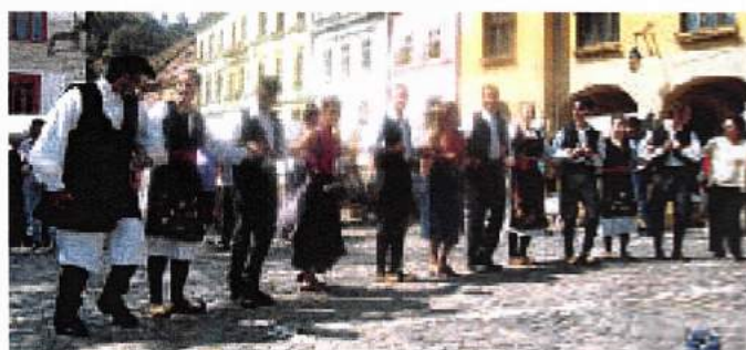
Grupul “Terra Mea” din Sardinia în hora alături de grupele sârbești au reunit participanți și spectatori în piața cetății.