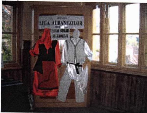
Liga Albanezilor a prezentat în cadrul expoziției de la sala Sander porturi populare tradiționale ale albanezilor din România.

„A doua ediție a Festivalului Pro Etnica 2002 se apropie cu pași repezi, făcând ca tensiunea echipei Centrului Educațional Interetnic pentru Tineret să fie în continuă creștere. Scena de desfășurare a spectacolelor este Cetatea Sighișoarei [...] Va exista și o secțiune teatrală, cu participarea Teatrului Național din Timișoara, trupa „Art Café” din Sibiu, a trupelor „Cameleon”, „Unde fugim de acasă” și „Teatrul de vacanță” din Sighișoara. La componentele civică, socială și spirituală, se vor desfășura mese rotunde,