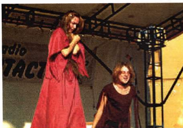
Trupa "Cameleon" cu piesa "...." au incantat publicul amator, alaturi de "Teatrul de Vacanta", Teatrul de Stat German Timisoara, "Unde fugim de acasa" si Trupa "Art Café"