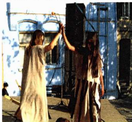
Trupa Cameleon prezintă pe scena din piața cetății piesa "Moarte pentru trădători"

F estival organizat de Centrul Educațional Interetnic pentru Tineret Sighișoara în colaborare cu reprezentanți a 17 minorități etnice din România – Albanezi, Armeni, Bulgari, Croați, Evrei, Greci, Germani, Italieni, Maghiari, Macedoneni Slavi, Ruși Lipoveni, Ruteni, Romi, Sârbi, Turci, Tătari, Ucraineni, Societatea Culturală a Aromânilor și fundațiile: Ion Budai Deleanu - Tîrnăveni, Armonia și Banat JA.