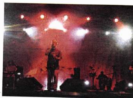
Seara de vineri a fost marcată de concertul trupei „Holograf”